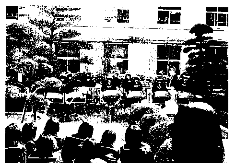
〔ミニミニ中庭コンサート〕

開校当初から続く駆足行進で、体力・意志力の練成を図るとともに、協調・団結の精神を培うことを目標としています。7限目のベルと同時に開始し、無言で更衣・集合・整列を8分で済ませ、準備体操の後、各クラスごとに体育委員の号令で出発します。「歩調をそろえる」「列を整える」をモットーに校庭を4～5周走る爽快な伝統行事です。